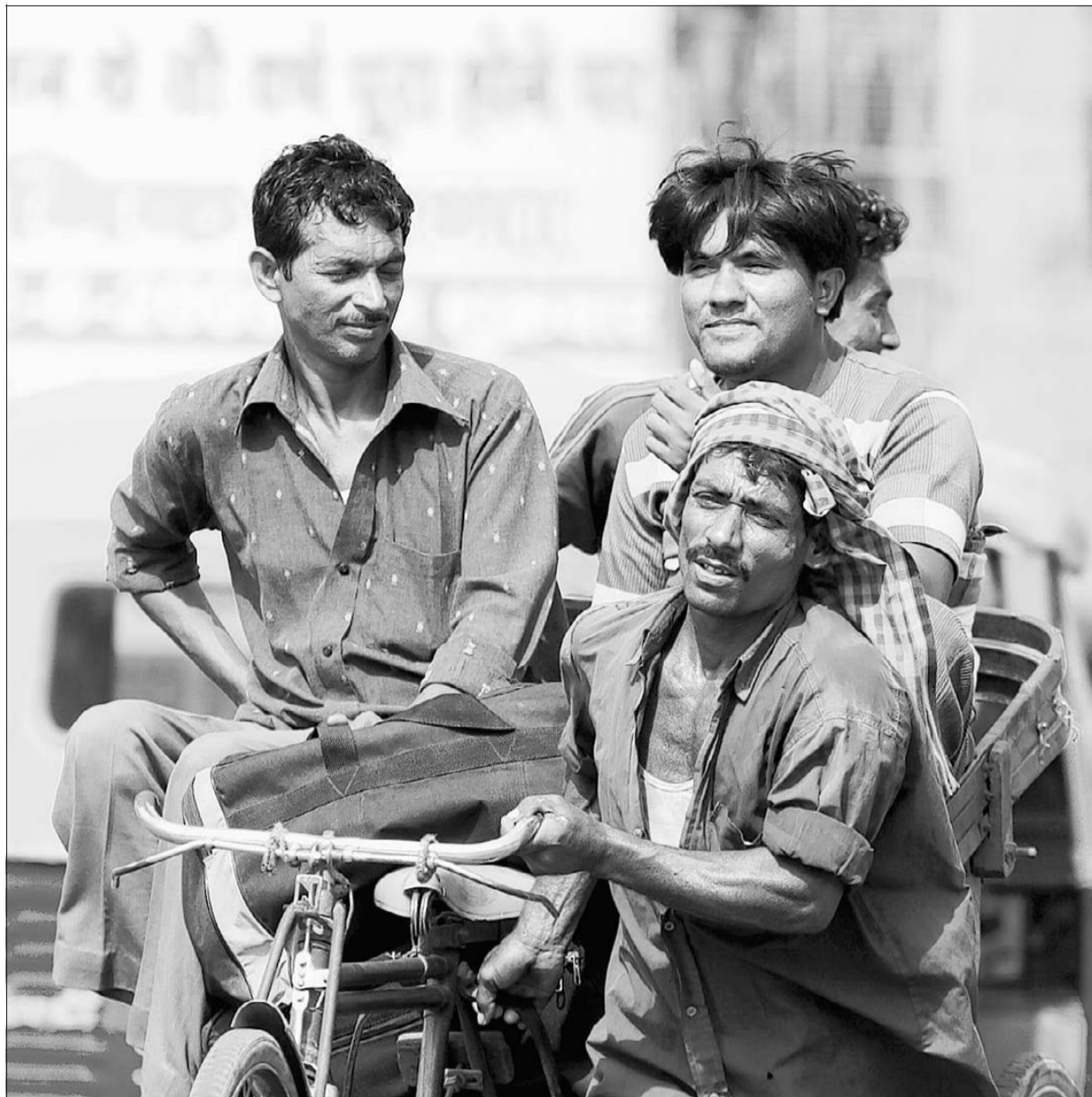
Auf die Menschen legte der 28-jährige Fotograf während seiner Reise durch Indien im vergangenen Jahr besonderen Wert.

punktförmigen Marketing und International Business in Stralsund beenden. „Wo es mich beruflich hinführt, kann ich noch nicht absehen. Erst einmal wird mich das Praktikum nach dem Studium höchstwahrscheinlich nach Asien führen“, erzählt der Student.